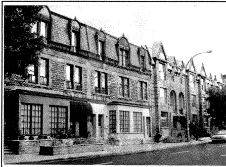
Côté nord de la rue Saint-Antoine: bâtiments de trois étages, généralement en pierre, avec ligne de toits brisée.