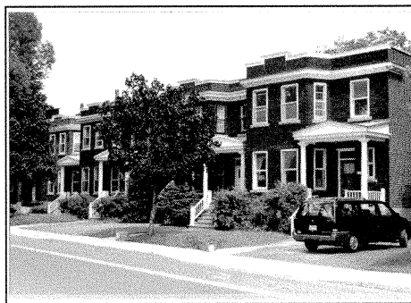
Côté sud du boulevard de Maisonneuve: porches en bois, à frontons, fenêtres en baie et corniches.