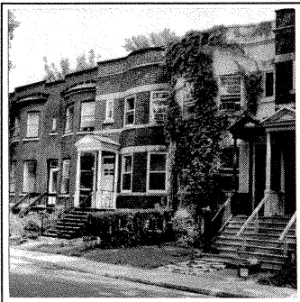
Côté sud de l'avenue Springfield: maisons en rangée de hauteur et de matériaux semblables situées près de la rue.

Strathcona: les maisons ont une marge de recul importante à l'avant, soit de 10,0 à 12,0 m du porche à la ligne de trottoir. On retrouve aussi une plus forte proportion (77 %) de maisons jumelées généralement espacées à intervalles de 4,5 et 6,0 m. Toutes les maisons sont en brique et ont presque toutes des toits plats avec des parapets droits. Plus de 90 % des maisons avaient à l'origine de grands porches de bois.